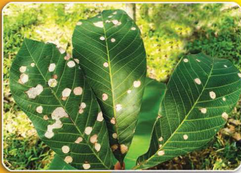
จุดแผลเนื้อเยื่อแห้ง (necrosis) สีน้ำตาลจนถึงขาวซีด

รูปร่างแผลค่อนข้างกลม เส้นผ่านศูนย์กลางมากกว่า 0.5-3 เซนติเมตร รอบแผลไม่มีวงสีเหลืองล้อมรอบ มีจำนวนจุดแผลมากกว่า 1 จุดบนใบ อาจเจริญลุกลามซ้อนกันเป็นแผลขนาดใหญ่