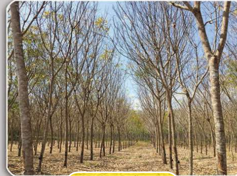
ต้นยางใบร่วงทั้งแปลง

3. หมั่นสำรวจแปลงยาง หากพบอาการทรงพุ่มไม่เขียวสด ใบเหลือง ให้ตรวจสอบอาการของโรคบนใบ และใบที่ร่วง