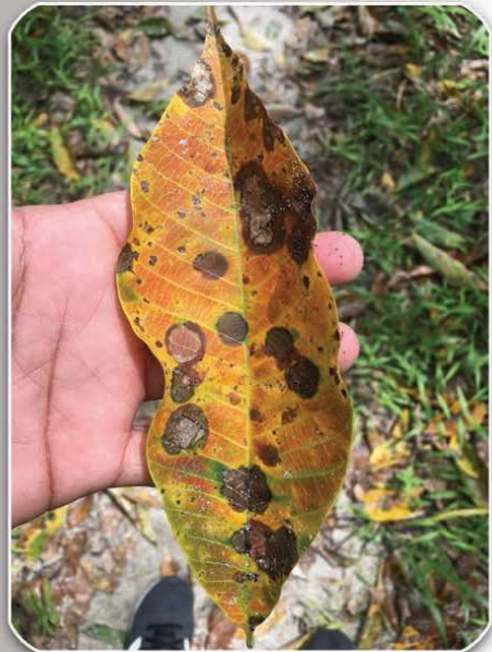
จุดรอยขีดค่อนข้างกลม เนื้อเยื่อบริเวณนี้จะขยายใหญ่ขึ้นเป็นสีคล้ำขอบแผลดำ