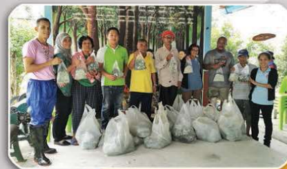
เกษตรกรใช้เชื้อราไตรโคเดอร์มาเพื่อควบคุมโรค และสร้างความแข็งแรงให้ต้นยาง

3. หมั่นสำรวจแปลงยาง หากพบอาการทรงพุ่มไม่เขียวสด ใบเหลือง ให้ตรวจสอบอาการของโรคบนใบ และใบที่ร่วง