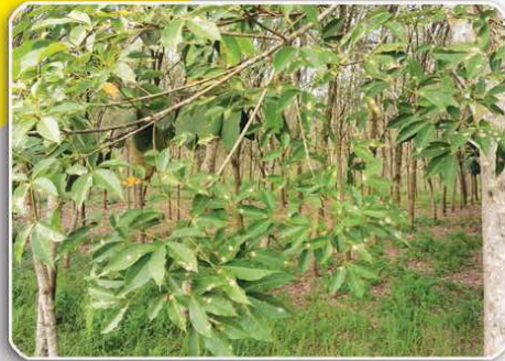
ใบยางเกิดจุดแผลแต่ไม่แสดงอาการใบร่วง

ระยะรุนแรงเกิดใบเหลืองและร่วงในที่สุด และอาจเกิดอาการแห้งตายจากยอดได้ หากเชื้อราเข้าทำลายกิ่งใกล้ปลายยอด กรณีเกิดการเข้าทำลายของเชื้อราที่รุนแรง อาจทำให้ใบยางร่วงในขณะที่อาการของจุดแผลบนใบยังไม่พัฒนาเป็นเนื้อเยื่อขาวซีดได้ หรือหากพันธุ์ต้นยางมีแนวโน้มทนต่อโรค อยู่ในสภาพที่ไม่เหมาะสมต่อการเกิดโรค จุดแผลอาจมีจำนวนน้อยและไม่เกิดอาการใบร่วง