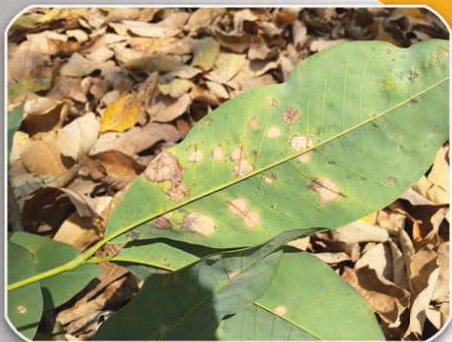
อาการจุดแผลเนื้อเยื่อตายด้านใต้ใบ

อาการเกิดขึ้นในใบแก่ เริ่มแรกจะเกิดรอยขีดค่อนข้างกลมบริเวณใต้ใบ ผิวใบด้านบนของบริเวณเดียวกันเป็นสีเหลือง (chlorosis) ต่อมาเนื้อเยื่อบริเวณนี้จะขยายใหญ่ขึ้นเป็นสีคล้ำขอบแผลดำ และกลายเป็นเนื้อเยื่อแห้ง (necrosis) สีน้ำตาลจนถึงขาวซีด