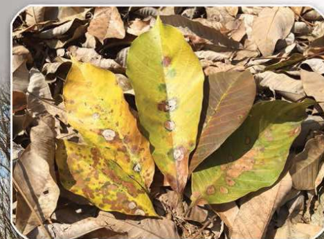
ระยะรุนแรงเกิดใบเหลืองและร่วงในที่สุด

โรคใบร่วงชนิดใหม่ที่ยังไม่เคยมีรายงานการพบในประเทศไทยมาก่อน สันนิษฐานว่าเกิดจากกระแสลมมรสุมที่พัดพาสปอร์ (spore) ของเชื้อราสาเหตุจากประเทศมาเลเซีย และสาธารณรัฐอินโดนีเซีย ผ่านเข้าสู่ภาคใต้ของประเทศไทย ซึ่งเกิดการแพร่ระบาดอย่างรวดเร็ว ปลายปี พ.ศ. 2562 มีรายงานการพบครั้งแรกบริเวณเนินเขาสูง ในจังหวัดนครราชสีมา ปัจจุบันพบการระบาดในพื้นที่ 9 จังหวัด ได้แก่ จังหวัดกระบี่ ตรัง นครราชสีมา บิดตานิ ฟังงา ยะลา สงขลา สตูล และจังหวัดสุราษฎร์ธานี