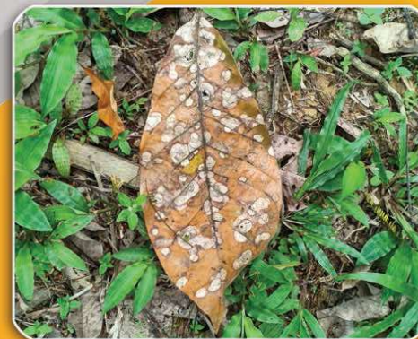
ใบร่วงที่แสดงอาการแผลจุด ควรนำไปทำลาย เพื่อลดการสะสมของเชื้อโรค

4. กำจัดใบยางที่เป็นโรคและวัชพืชในแปลง เพื่อกำจัดและลดการสะสมของเชื้อสาเหตุโรค