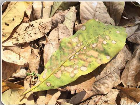
จำนวนจุดแผลมากกว่า 1 จุดบนใบ อาจเจริญลุกลามซ้อนกันเป็นแผลขนาดใหญ่

รูปร่างแผลค่อนข้างกลม เส้นผ่านศูนย์กลางมากกว่า 0.5-3 เซนติเมตร รอบแผลไม่มีวงสีเหลืองล้อมรอบ มีจำนวนจุดแผลมากกว่า 1 จุดบนใบ อาจเจริญลุกลามซ้อนกันเป็นแผลขนาดใหญ่